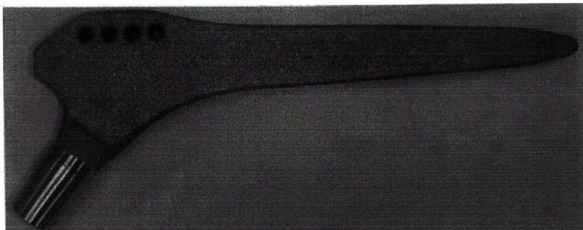
Фотографическое изображение 1