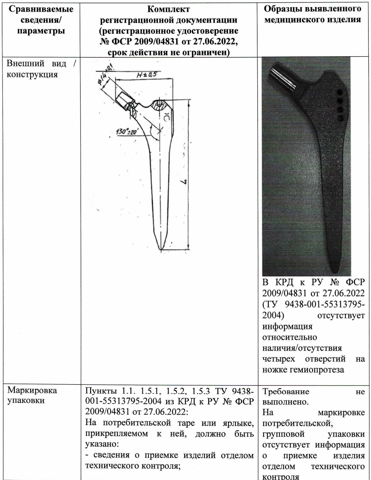
Таблица сопоставления параметров и характеристик, указанных в комплекте регистрационной документации, с параметрами и характеристиками образцов выявленного медицинского изделия