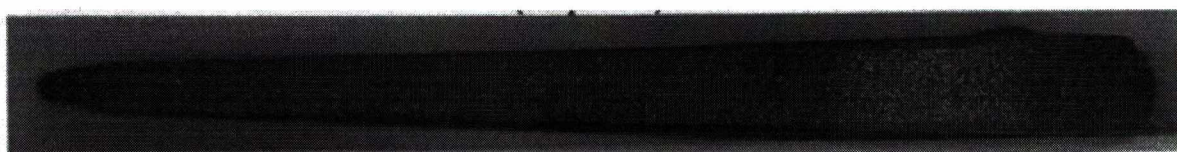
Фотографическое изображение 2