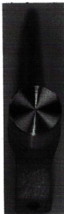
Фотографическое изображение 3